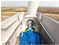
· 산업용 기어박스