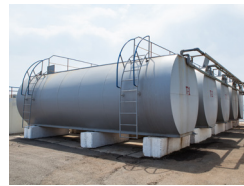
· 유류 저장 및 운반용 탱크