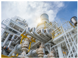
· 유압 시스템